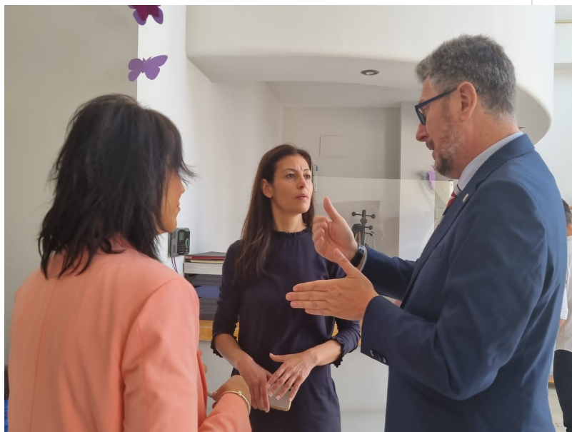
( http://www.aljaraque.es/export/sites/aljaraque/es/.galleries/imagenes-noticias/noticias-2022/Mayo-2022/IMG-20220508-WA0014.jpg )