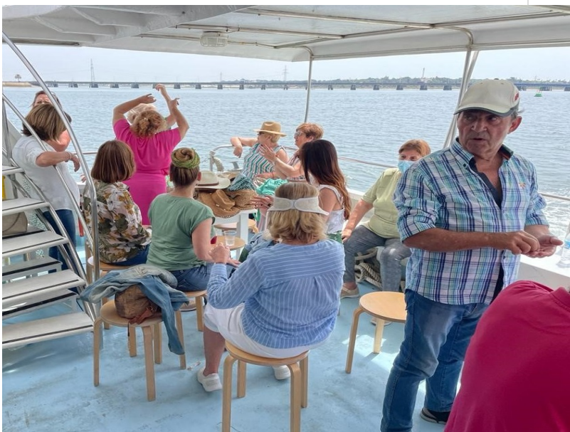
( http://www.aljaraque.es/export/sites/aljaraque/es/.galleries/imagenes-noticias/noticias-2022/Mayo-2022/Viaje-catamaran-_4.jpg )