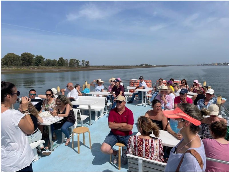
( http://www.aljaraque.es/export/sites/aljaraque/es/.galleries/imagenes-noticias/noticias-2022/Mayo-2022/Viaje-catamaran-2.jpg )